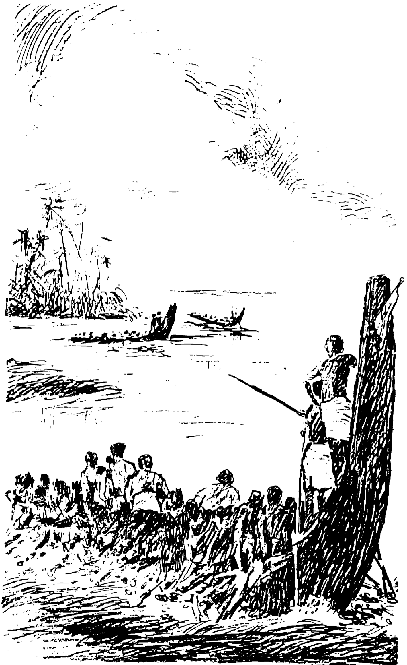
चित्र : ओनम मनाते केरलवासी लोग